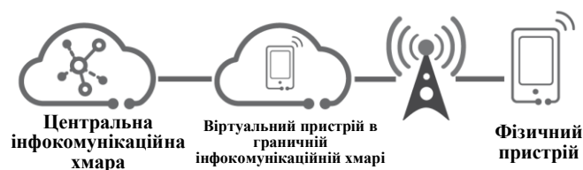
Рисунок 2 – Схема реалізації віртуального пристрою

В результаті розвитку технології хмарних обчислень та ІоЕ та завдяки можливості підключення 6G збільшується кількість фізичних пристроїв 6G із можливістю отримання віртуального двійника у хмарі (рис. 2). Завдяки децентралізації персональні дані користувачів можуть зберігатися на віртуальних пристроях під контролем користувачів, а не на мобільних пристроях або в централізованих сховищах, що належать третій стороні, що позбавляє користувачів від побоювань з приводу потенційних проблем з конфіденційністю. На основі концепції віртуалізованих пристроїв з'являться загальні пристрої 6G, які зазвичай знаходяться у громадських місцях та використовуються по запиті. Завдяки інтеграції біометрії, штучного інтелекту, персоналізованого автоматичного налаштування та технологій захисту конфіденційності пристрої 6G зможуть надавати прості у використанні функції, такі як біометрична автентифікація та гіперперсоналізовані конфігурації. Це дозволить кінцевим користувачам отримувати доступ до бажаних послуг через спільні пристрої у будь-який час та в будь-якому місці. Перелік типів загальних пристроїв 6G може бути досить великим, включаючи автомобілі, що орендуються, конференц-зали, хмарні пристрої та будь-які інші пристрої з можливостями вводу/виводу та обчислювальними можливостями, які можна використовувати спільно або орендувати в громадських місцях.