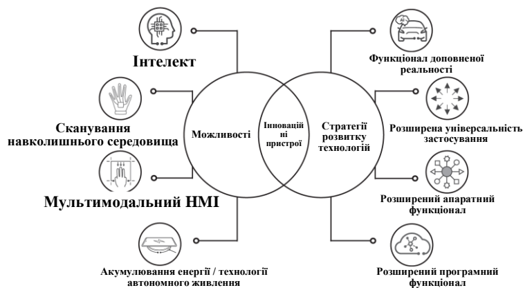
Рисунок 1 – Телекомунікаційні пристрої наступних поколінь

Враховуючи перераховані функціональні можливості, можна виділити чотири основні тенденції розробки мобільних пристроїв, як показано на рис. 1.